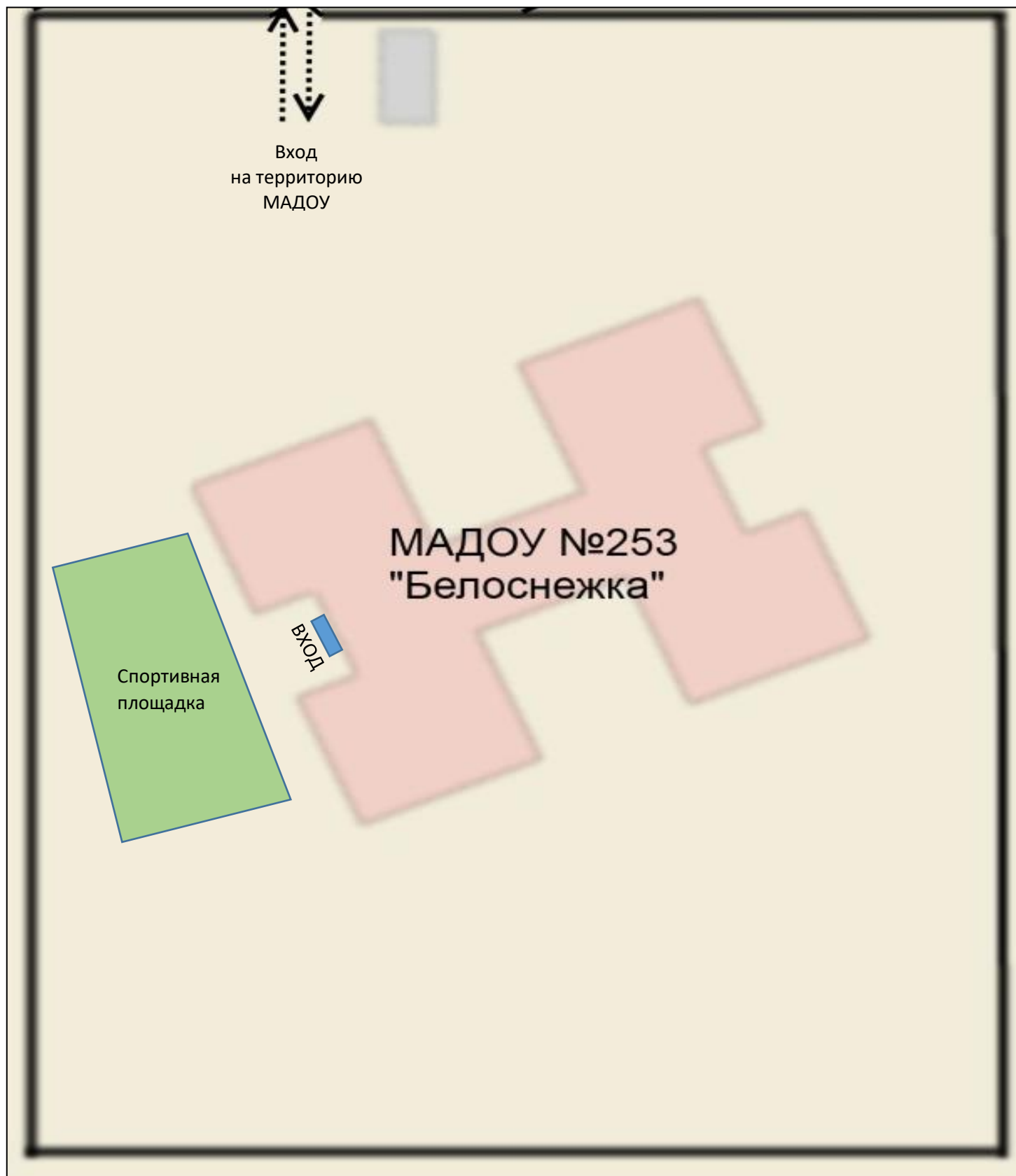
Схема размещения спортивной площадки на территории МАДОУ